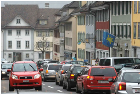
Abendstau im Flecken