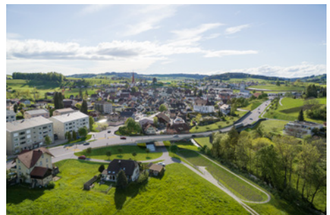
Ostumfahrung; Visualisierung Knoten Luzernerstrasse mit Brücke «Under Brugg»

Die neue Umfahrungsstrasse durchquert am östlichen Siedlungsrand das Tal der Wyna. Dazu ist der Bau einer Brücke mit dem Namen «Under Brugg» vorgesehen, die aus einem Wettbewerbsverfahren als Bestvariante hervorgegangen ist. Die Brücke ist so konstruiert, dass sie schlank und filigran erscheint. Der Lärmschutz auf der Brücke wird mit einer transparenten Glaskonstruktion sichergestellt. Das Strassenabwasser wird vor der Einleitung in die Wyna gereinigt. Dafür ist unter der Brücke an der Wyna der Bau einer Strassenabwasserbehandlungsanlage vorgesehen.