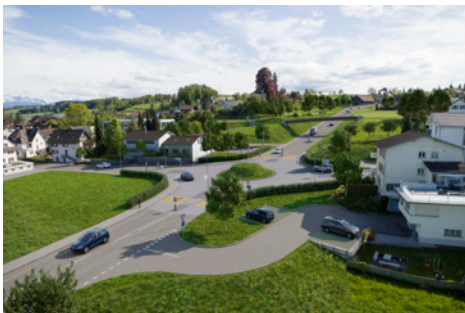
Westumfahrung; Visualisierung Kreisel Schuelgass, Blick Richtung Schenkon

Die Mehrheit des Kantonsrates unterstützte deshalb das vorliegende Projekt Ost- und Westumfahrung Flecken Beromünster. Für Zustimmung zum Dekret sprachen sich die Fraktionen der Mitte, der FDP und der SVP aus, während die Fraktion der Grünen / Jungen Grünen (12 von 13 Stimmenden) und grössere Minderheiten der SP-Fraktion (9 von 19) und der GLP-Fraktion (3 von 8 Stimmenden) für eine Rückweisung der Vorlage an den Regierungsrat zwecks Überarbeitung plädierten.