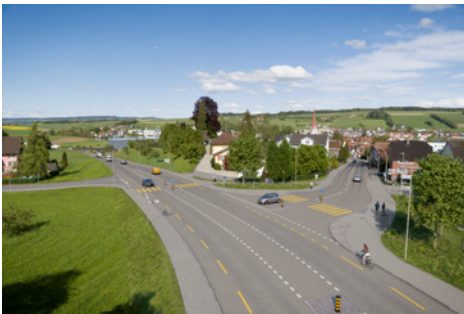
Westumfahrung; Visualisierung Knoten Surseestrasse, Blick Richtung Aargauerstrasse

Die Ost- und Westumfahrung Flecken Beromünster ist im kantonalen Richtplan enthalten und Bestandteil des Bauprogramms 2023–2026 für die Kantonsstrassen.