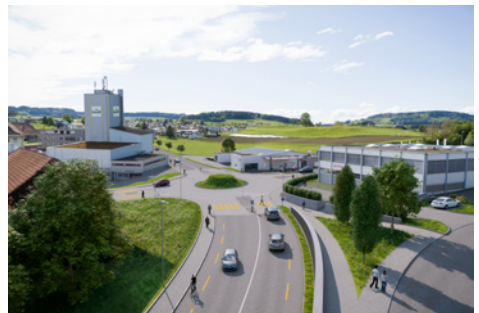
Visualisierung Kreiselschuelgass, Blick Richtung Westen

Die Emissionen (Lärm, Erschütterungen, Abgase) im Ortskern werden reduziert, was sich positiv auf die Lebensqualität der Anwohnerinnen und Anwohner und die (historische) Bausubstanz auswirkt. Das Strassennetz im Flecken ist heute lärmsanierungspflichtig: Bei rund 76 Gebäuden werden die Lärmgrenzwerte überschritten. Mit der Umfahrungsstrasse kann die Lärmbelastung der Gebäude im Flecken im Mittel um mehr als 10 Dezibel gesenkt werden. Im Jahr 2030 können damit die Immissionsgrenzwerte im Flecken vollumfänglich eingehalten werden. Im Bereich der Verzweigung Luzernerstrasse bleiben bei zwei Gebäuden die bereits heute vorhandenen Überschreitungen der Immissionsgrenzwerte bestehen. Beim Kreiselschuelgass wird bei einem Gebäude neu die Nordwestfassade anstelle der Nordostfassade über dem Immissionsgrenzwert belastet. Dank der koordinierten landschaftspflegerischen Begleitplanung konnte die Umfahrungsstrasse mit ihren Kunstbauten gut in die Landschaft und ins Ortsbild eingegliedert werden. Mit verschiedenen Massnahmen werden zudem lokal ökologische Aufwertungen erzielt.