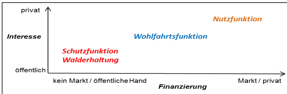
Abbildung 2: Öffentliche und private Bedeutung und Finanzierung der Schutz-, Wohlfahrts- und Nutzfunktionen des Waldes sowie der Walderhaltung.

Aus Sicht des Kantons bestehen an die Leistungserbringer – seien es RO oder andere betriebliche Waldorganisationen – die gleichen Anforderungen. Im Vergleich zu den Forstbetrieben von anderen betrieblichen Waldorganisationen haben die RO kaum direkten Zugriff auf die Nutzungsrechte der angeschlossenen Waldeigentümerinnen und -eigentümer. Die Leistungsfähigkeit der RO ist deshalb abhängig von einem hohen Organisationsgrad beziehungsweise von einer bedeutenden Ausdehnung. Für Effizienzvorteile sind zudem eine eigentumsübergreifende Planung und Bewirtschaftung wichtig. Für die Beratung der Waldeigentümerinnen und -eigentümer im Normalwald kann auf das Fachwissen der Forstfachpersonen der betrieblichen Waldorganisationen abgestützt und in diesem Bereich ein paralleles staatliches Angebot ersetzt beziehungsweise auf die strategische Ebene der betrieblichen Waldorganisationen ausgerichtet werden.