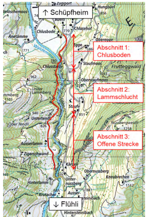
Übersicht der Abschnitte 1 bis 3 des Ausbaus der Kantonsstrasse durch die Lammschlucht.

Escholzmatt-Marbach) und ist Gegenstand dieser Abstimmungsvorlage. Die Neu- und Ausbaukosten belaufen sich nach aktuellem Stand auf 37,937 Millionen Franken. Die Kostendifferenz von knapp 4 Millionen Franken zu dem im Bauprogramm eingeplanten Betrag begründet sich hauptsächlich mit der hohen Komplexität der Bedingungen in diesem Abschnitt.