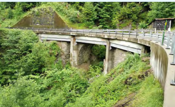
Die Bogenbrücke Oberlammsberg ist in einem schlechten Zustand und muss ersetzt werden.

Der Kantonsrat hat den zweiten Abschnitt des dreiteiligen Ausbaus der Kantonsstrasse von Schüpfheim nach Flühli und Sörenberg durch die Lammschlucht beschlossen und dafür einen Kredit von 37,937 Millionen Franken bewilligt. Mit dem Projekt werden die Verkehrssicherheit erhöht, der Schutz vor Naturgefahren verbessert und die Unterhaltskosten gesenkt. Der Ausbau des zweiten Abschnitts soll bis 2030 abgeschlossen sein. Kantons- und Regierungsrat empfehlen den Stimmberechtigten, das Projekt anzunehmen.