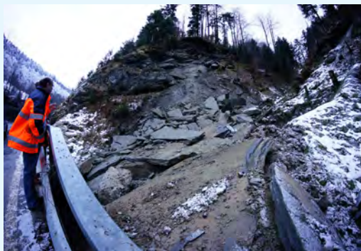
Felssturz an der Kantonsstrasse im Jahr 2014.