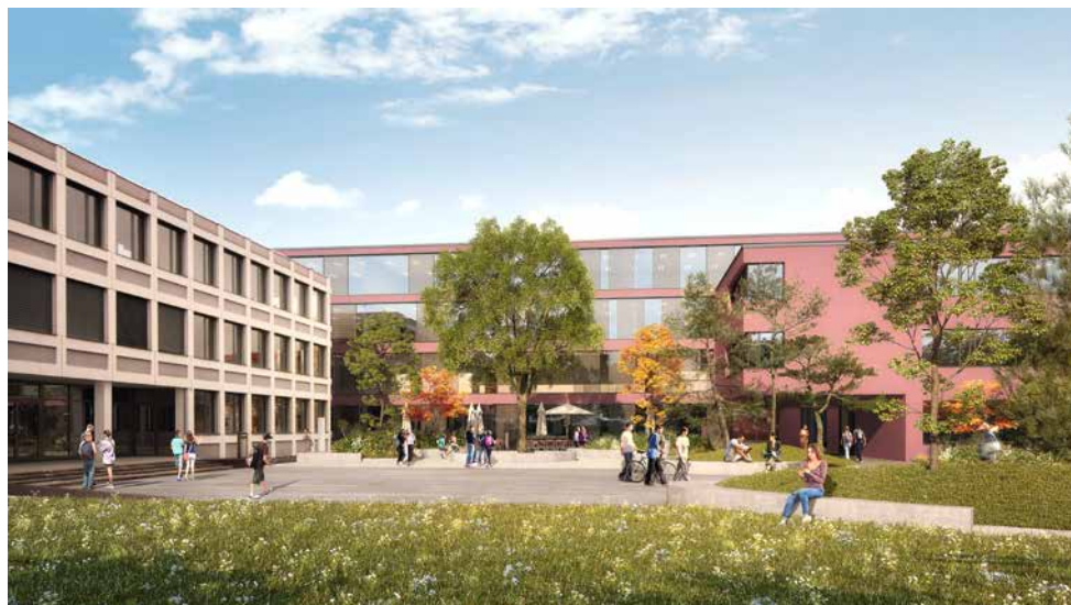
Visualisierung des Neubaus zwischen dem Hauptgebäude links und dem Erweiterungsbau von 2005 rechts

Im Namen des Regierungsrates Der Präsident: Fabian Peter Der Staatsschreiber: Vincenz Blaser