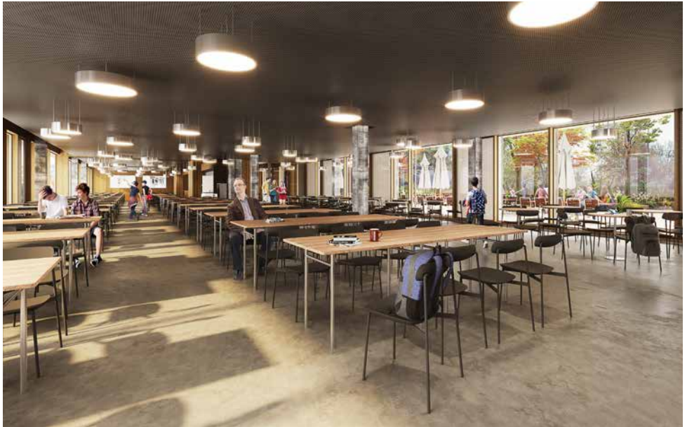
Visualisierung der Mensa im Neubau, rechts Blick in den zentralen Hof der Schulanlage

Der bestehende Erweiterungsbau aus dem Jahr 2005 wird um ein Geschoss auf insgesamt vier Geschosse aufgestockt und teilweise technisch erneuert. Das rund 50 Jahre alte Hauptgebäude wird umfassend saniert. Die Unterrichtszimmer für