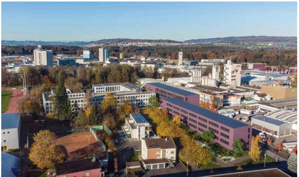
Visualisierung des Neubaus und des aufgestockten Erweiterungsbaus (rötliche Bauten)

An zentraler Lage im Erdgeschoss des Neubaus bietet die neue Mensa für 350 Schülerinnen und Schüler sowie Mitarbeitende und Besuchende ein breites Verpflegungsangebot. Ausserhalb der Essenszeiten wird sie ein attraktiver Treffpunkt und Arbeits-