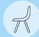
Nur Sitzplätze (Ausnahmen möglich)