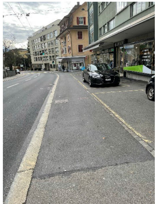
Standort 9 – Gerliswilstrasse 69, Parkplätze