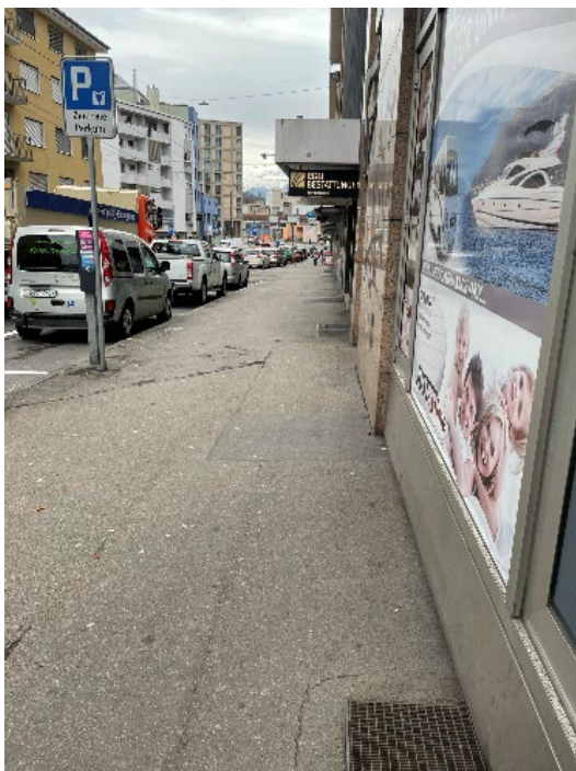
Standort 8 – Gerliswilstrasse 43, Parkplätze