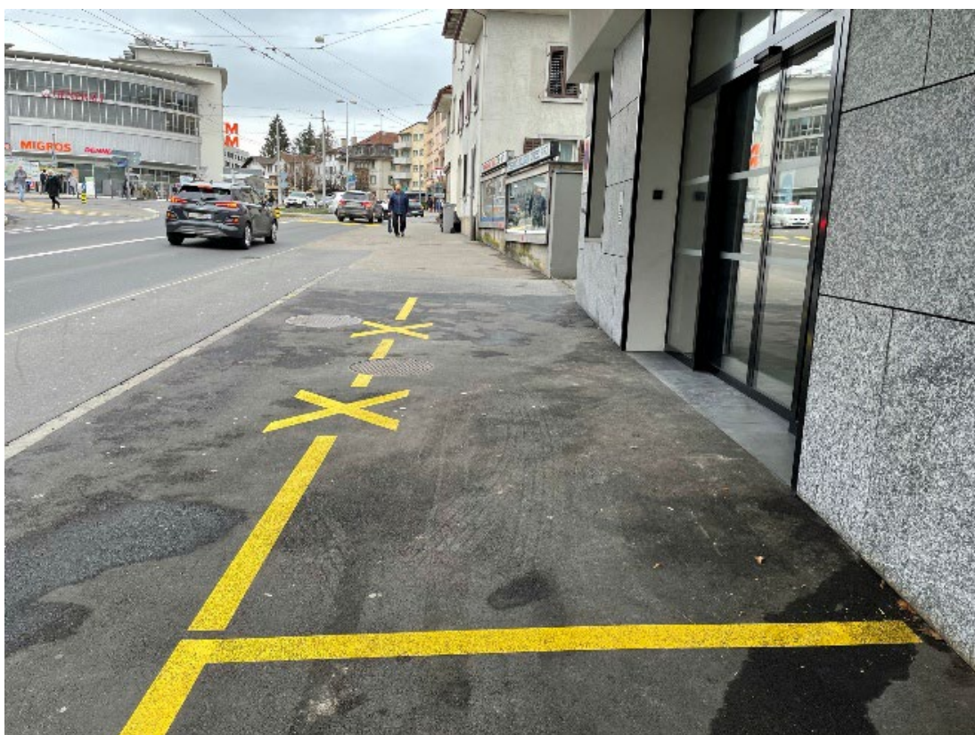
Standort 2 – Gerliswilstrasse, JYSK-Anlieferung