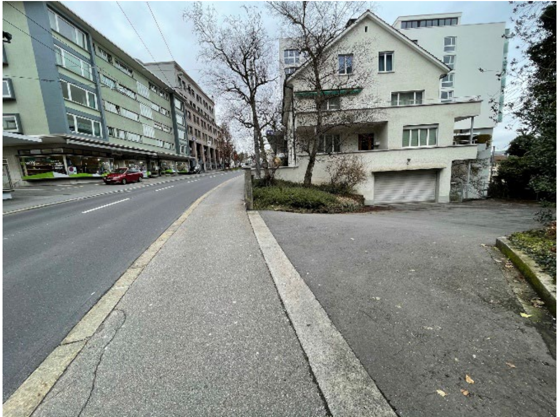
Standort 3 – Zufahrt Gerliswilstrasse 66A