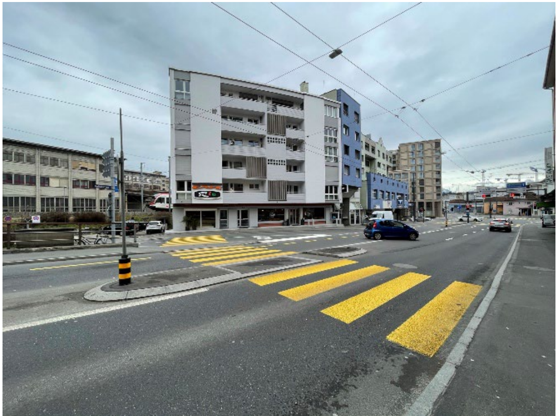
Standort 7 – Gerliswilstrasse 39, Fussgängerstreifen