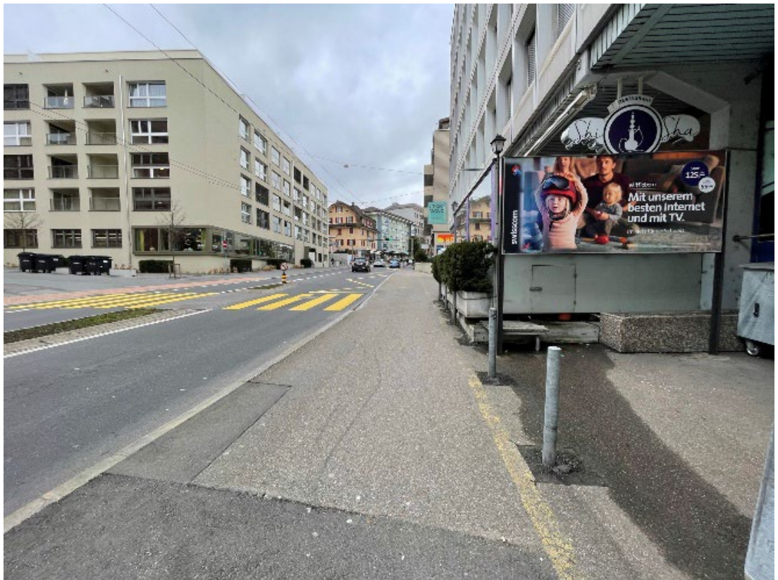
Standort 4 – Gerliswilstrasse, Bushaltestelle Richtung Sonnenplatz