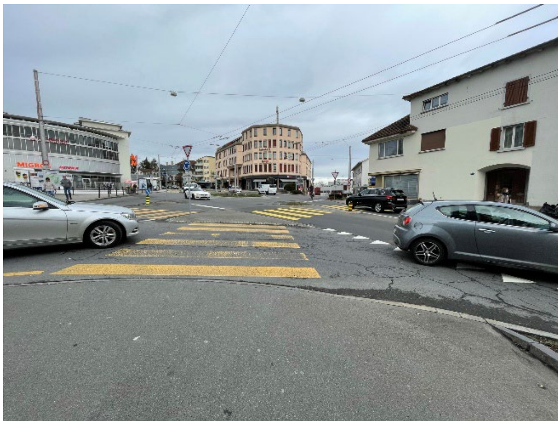
Standort 1 – Gerliswilstrasse, Kreisel Sonnenplatz