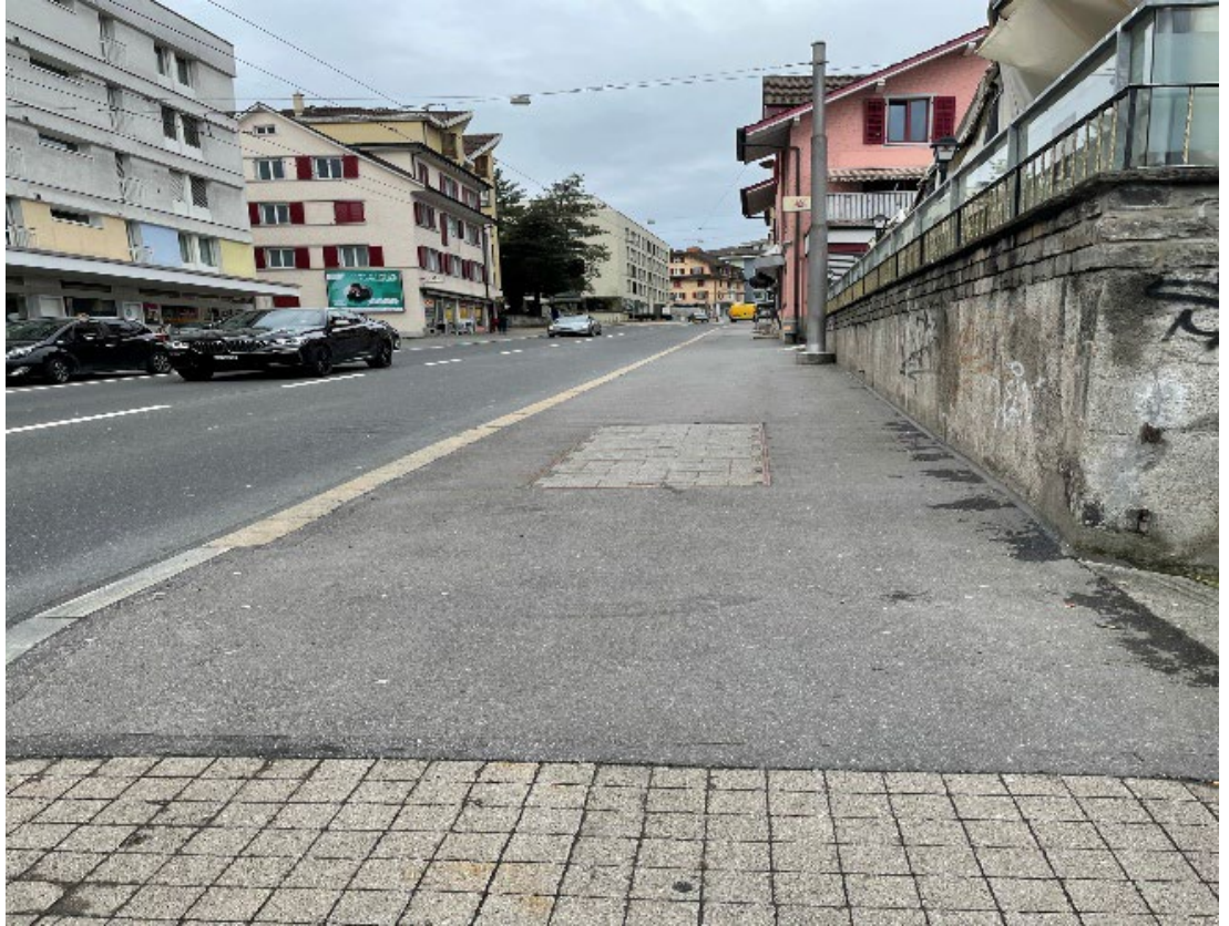
Standort 5 – Überblick Gerliswilstrasse, Richtung Kreisel Sonnenplatz