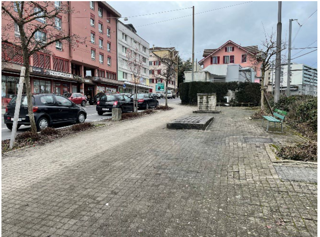
Standort 6 –Gerliswilstrasse, Parkanlage