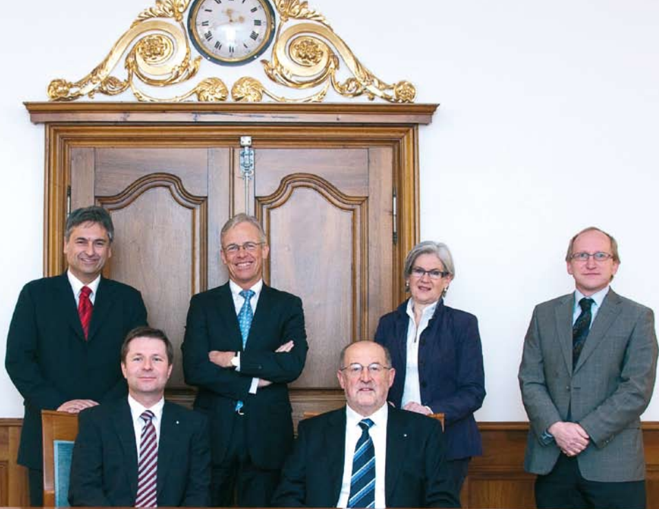
Die Regierung des Kantons Luzern