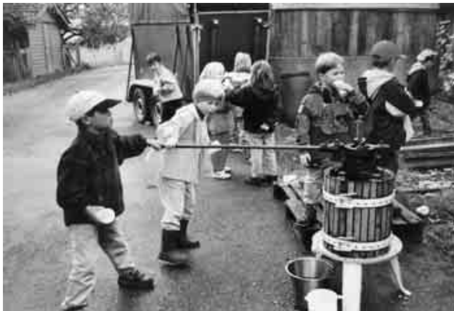
Kinder dürfen beim «Mosten» selber Hand anlegen und freuen sich auf den süssen Saft.

SchuB Luzern, c/o Luzerner AgrarMarketing, Schellenrain 5, 6210 Sursee Telefon 041 925 80 24, Fax 041 921 73 37 marketing@luzernerbauern.ch www.schub.ch