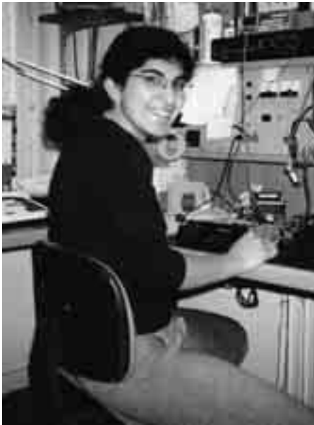
Erste Schritte in der Berufswelt

Dieses Jahr wird auch der Zentralschweizer Rahmenlehrplan eingeführt, der unter Federführung der Bildungsplanung Zentralschweiz zusammen mit Lehrpersonen erarbeitet wurde. Er gibt die pädagogisch-didaktische Grundrichtung vor und legt fest, welche inhaltlichen Schwerpunkte bei jedem Typ gesetzt werden. Die Anpassung der Wochenstundentafeln erfolgt mehrheitlich 2007.