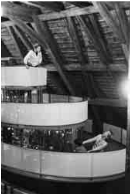
Das neue Traumschloss auf Schloss Heidegg begeistert Jung und Alt.

Der Rosengarten ist täglich ganztags geöffnet. www.heidegg.ch