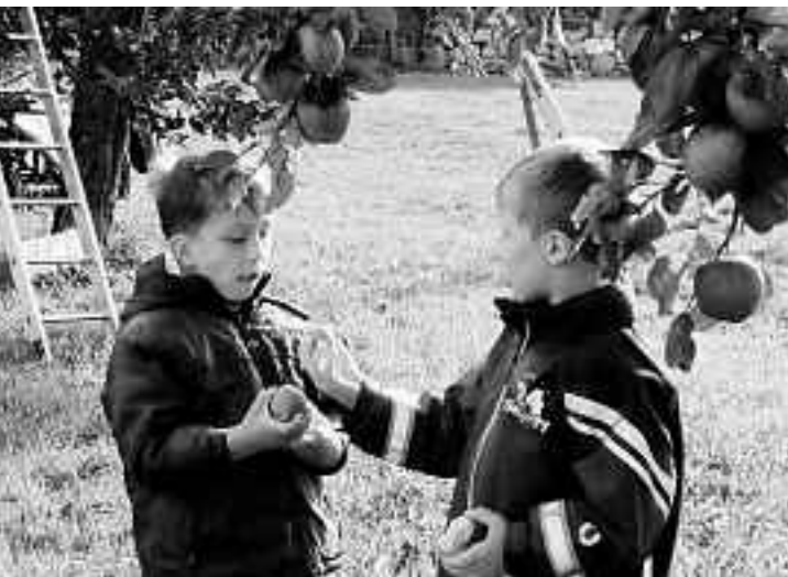
Frisch gepflückt schmecken die Äpfel am besten.