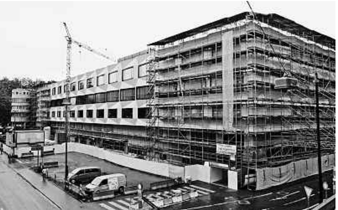
Das künftige UNI-PHZ-Gebäude

Lange musste die ZHB auf entscheidende bauliche Massnahmen warten. Dementsprechend gross ist nun die Freude in der ZHB und bei den Partnerinstitutionen. Es gibt einiges zu tun. Der erwartbare Aufwand wird allerdings durch das anvisierte Ziel allemal legitimiert. Denn das vorgesehene Projekt verspricht eine überzeugende Lösung für die Betriebsanforderungen an eine zeitgemässe und zukunftsorientierte Bibliothek.