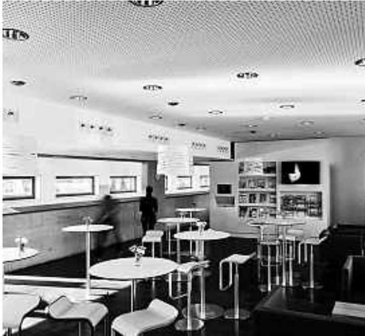
Die «Oase» der Hochschule Luzern – Wirtschaft

Zuvor hatten Mitarbeitende und Studierende dem Speisesaal schlechte Noten ausgestellt. Entstanden ist nun ein in unterschiedliche Nutzungszonen unterteilter, attraktiver Ort, in dem neben dem Appetit auch die Bedürfnisse nach Erholung und Informationen befriedigt werden. Aufgelegt sind stets die Tagespresse und Fachliteratur, zudem ermöglicht ein Fernseher Einblick ins aktuelle Nachrichtengeschehen. Frische Farben schaffen eine erholende Atmosphäre und gaben der Räumlichkeit den neuen Namen «Oase». Die Mensa steht auch Besuchern offen.