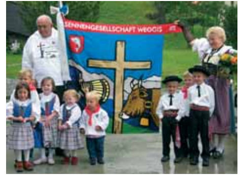
An der Sennenkilbi

Seit 1850 fast ununterbrochenes, seit 1980 stark beschleunigtes Bevölke- rungswachstum auf heute rund 3'920 Einwohner/innen